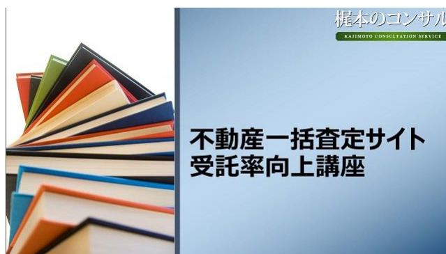
(「不動産一括査定サイト 受託率向上講座」TOP画面)