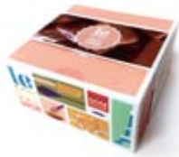
4-oz gift box 約113.4g

CT : 8pcs PKG Size : W10.2×D10.2×H5.1cm 賞味期限 : 6ヶ月