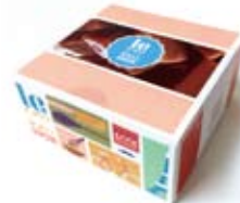
4-oz gift box 約113.4g

CT : 8pcs PKG Size : W10.2×D10.2×H5.1cm 賞味期限 : 6ヶ月