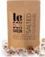
4-oz bag 約113.4g

CT : 10pcs PKG Size : W13×D7.9×H20.6cm 賞味期限 : 6ヶ月