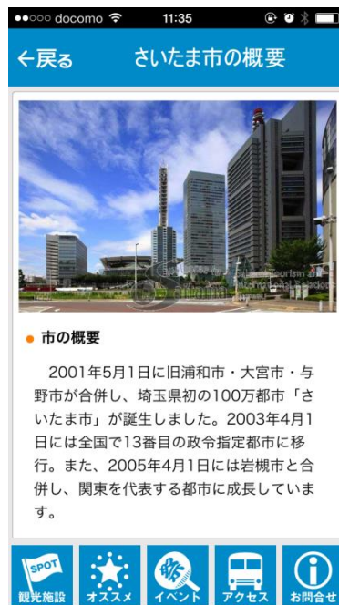
(さいたま市の概要)