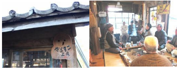
だらすこ工房とそのメンバーたち

野田村の山中にある小さな木工工房。震災による悲しみのなか、未来に希望をつないでいくことを目指して、5人のメンバーで始めました。村を守るために倒れた防潮林の黒松を用いて作る木工品は、震災の記憶と復興してゆく被災地の姿を伝えるための商品です。