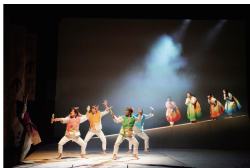
子どもに見せたい舞台 vol.13 © 田中亜紀 『春春～ポムポム～』舞台写真