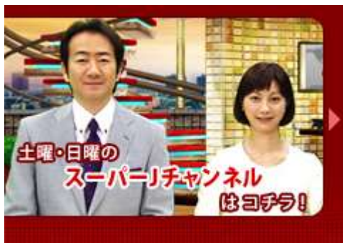
2012年7月16日 テレビ朝日系列放映