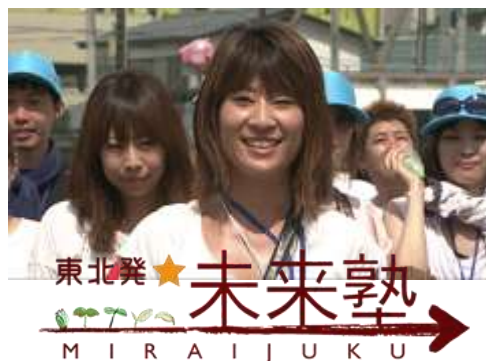
2012年9月8日 NHK Eテレ 全国放映