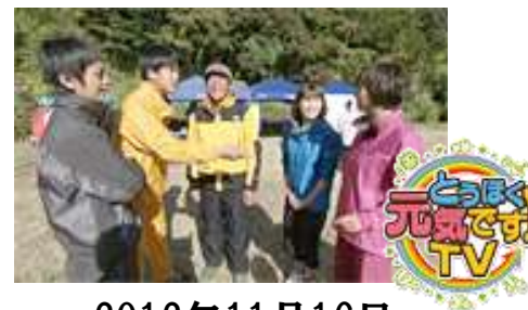
2012年11月16日 東日本放送放映