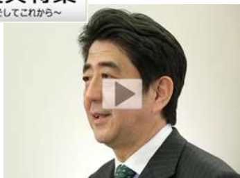
2013年3月11日 安倍総理大臣メッセージ 「3・11をむかえて」に引用