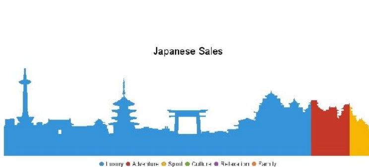
プロポーショナルインフォグラフィックススタイルチャート