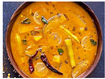
南インドカレー(イメージ)