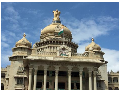
ビダーナ・サウダ

北インドカレーは濃厚でナンと一緒に食べるのに適していますが、南インドカレーは、菜食のカレーも多くスープ状でご飯と相性が良いカレーです。下町のプレマお母さんのお家で「おうちカレー」を学びます。