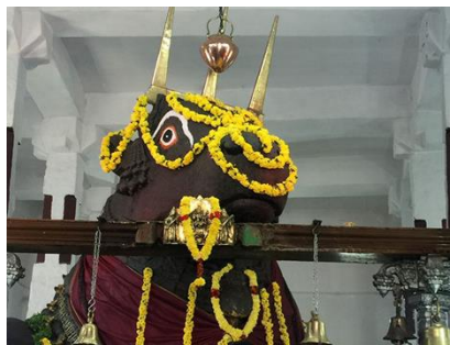
ブル寺院ナンディ像