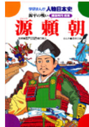
学研まんが人物日本史 源頼朝 源平の戦い