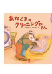
あなぐまの クリーニング屋さん