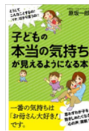
子どもの本当の気持ち が見えるようになる本