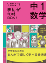
中1数学 (まんがが攻略 BON!)