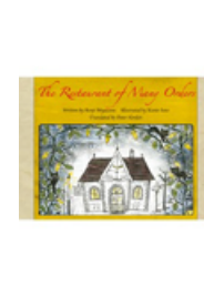
The Restaurant of Many Orders