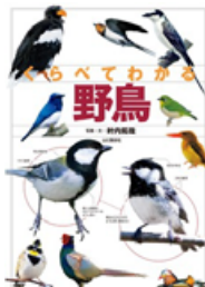
くらべてわかる野鳥