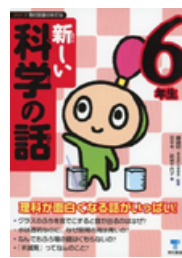
新しい科学の話 6年生