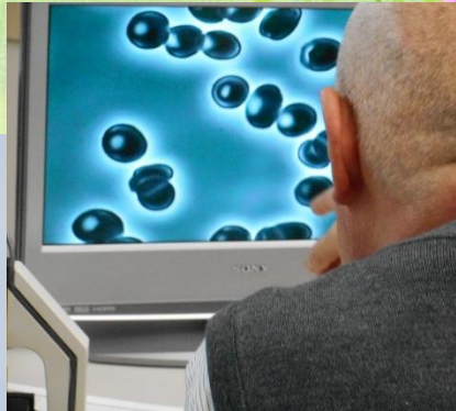
ソマチッドの観察