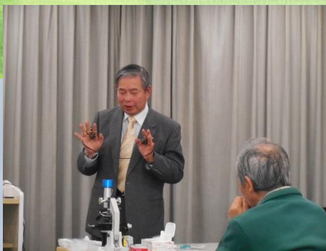
遠隔ヒーリング体験