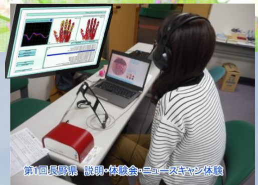
ニュースキャン測定

日々 羅天清研究会 新潟の活動に皆様方から暖かいご支援ご協力を頂き心より感謝申し上げます。すでに皆さまもご存知の通り羅天清研究会 新潟で遠隔ヒーリングの展開を進めてまいりましたが、お蔭様をもちましてこの度、下記の通り新たに一般社団法人を発足させることとなりました。今後もご支援くださる皆様のご期待に沿うべく、よりいっそうの情熱を持って邁進する所存でございますので、何卒倍旧のお力添えを賜りますようお願い申し上げます。