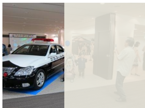
昨年度の様子