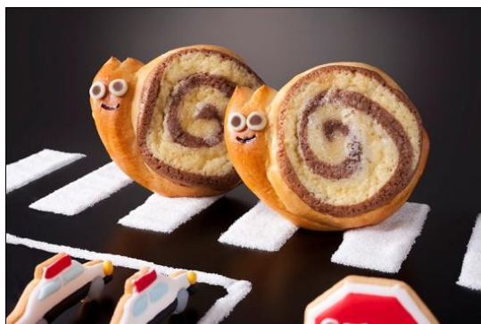
の～んびりいこうや！かたつむりパン