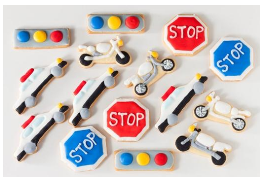
交通安全クッキー各種