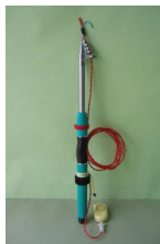
〔工事用火災警報器/ロッド付〕