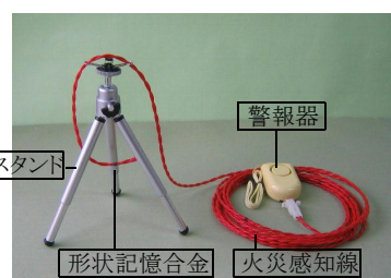
〔工事用火災警報器/スタンド付〕