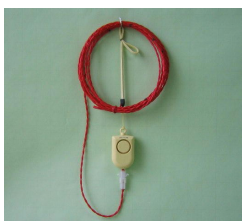
〔工事用火災警報器〕