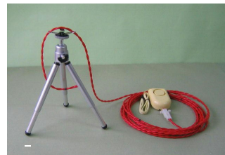
〔工事用火災警報器/スタンド付〕